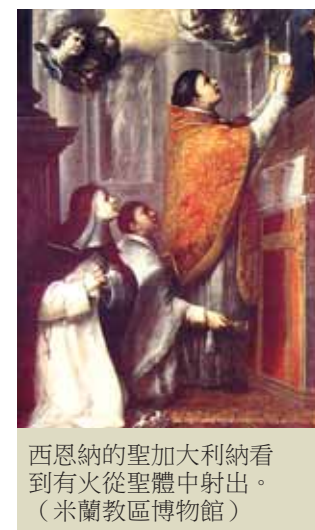
西恩納的聖加大利納看到有火從聖體中射出。 (米蘭教區博物館)