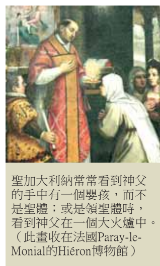
聖加大利納常常看到神父的手中有一個嬰孩，而不是聖體；或是領聖體時，看到神父在一個大火爐中。 (此畫收在法國Paray-le-Monial的Hiéron博物館)