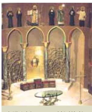
由雕刻家Manzù所刻的牧者，放置在大殿上層。