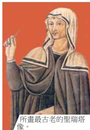
所畫最古老的聖瑞塔像。