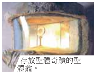
存放聖體奇蹟的聖體龕。