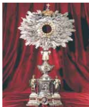
存放聖體奇蹟的聖體光。