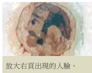
放大右頁出現的人臉。