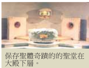
保存聖體奇蹟的聖堂在大殿下層。