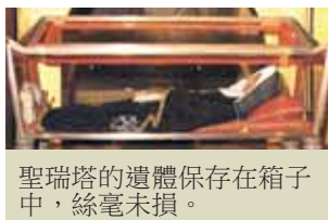
聖瑞塔的遺體保存在箱子中，絲毫未損。