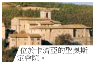
位於卡濟亞的聖奧斯定會院。

1330年時，在卡濟亞，有一位農夫生了重病，請神父來為他送聖體。冷漠的神父心不在焉地順手將聖體夾在經本中，而不是放在聖體盒中。一到農人家，神父打開經本，赫然看見聖體變為血塊，血跡染遍經書。