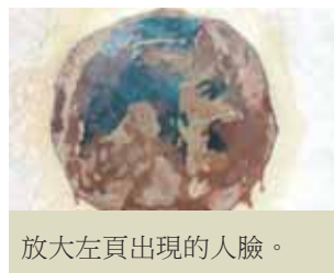
放大左頁出現的人臉。