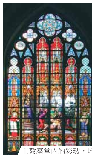
主教座堂內的彩玻，均描繪聖體奇蹟。