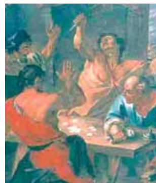
《布魯塞爾的聖體奇蹟》，收藏於法國Paray-le-Monial，Hiéron博物館。