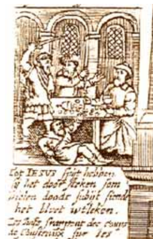
描繪聖體奇蹟的古畫。