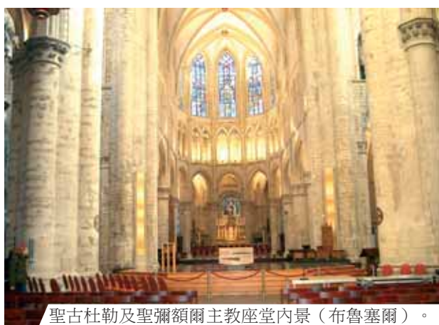
聖古杜勒及聖彌額爾主教座堂內景（布魯塞爾）。