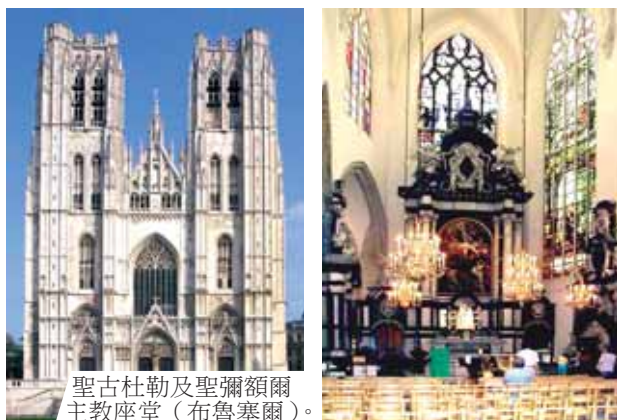
聖古杜勒及聖彌額爾主教座堂（布魯塞爾）。