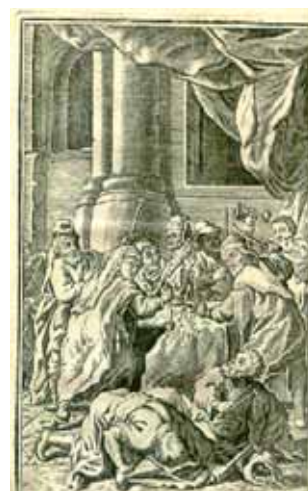
描繪聖體奇蹟的古畫。