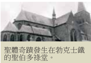
聖體奇蹟發生在勃克士鐵的聖伯多祿堂。