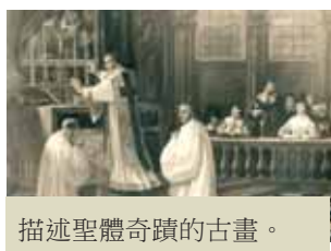
描述聖體奇蹟的古畫。