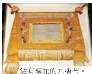
沾有聖血的九摺布。