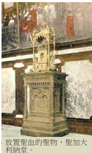
放置聖血的聖物，聖加大利納堂。