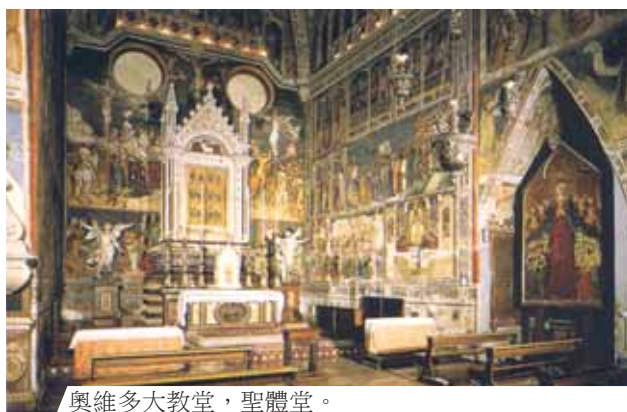
奧維多大教堂，聖體堂。