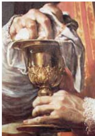
《波瑟納聖體奇蹟》細部（由Francesco Trevisani所繪）。