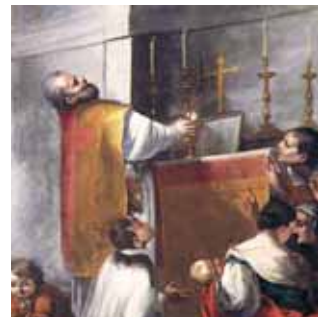
《波瑟納的感恩禮》，由Francesco Robbio所繪（米蘭教區博物館收藏）。