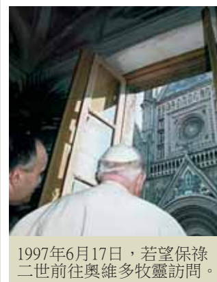
1997年6月17日，若望保祿二世前往奧維多牧靈訪問。