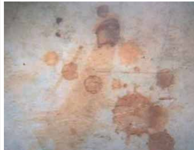
沾了聖血的石頭細部，目前存放於波瑟納。