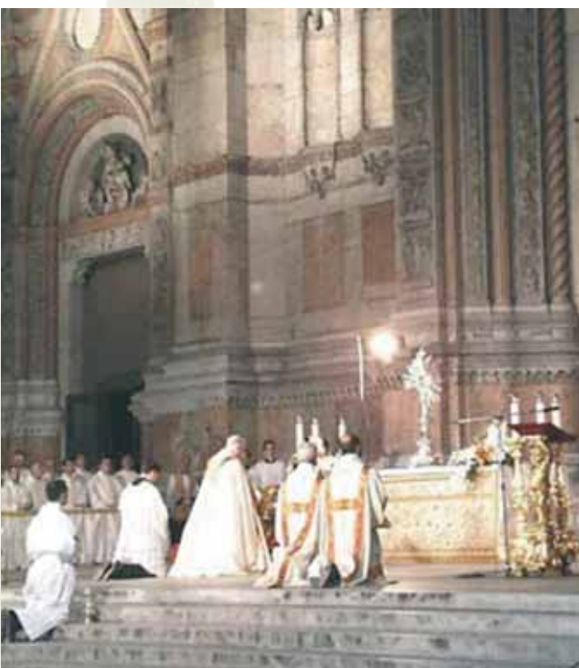
紀念聖體聖血節所舉行的公拜聖體（奧維多收藏）。