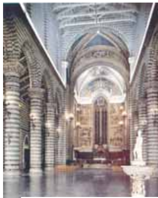
奧維多大教堂內部。