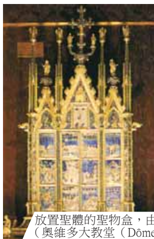
放置聖體的聖物盒，由Ugolino da Vieri工作室所繪（奧維多大教堂（Dôme de Orvieto），1338年）。