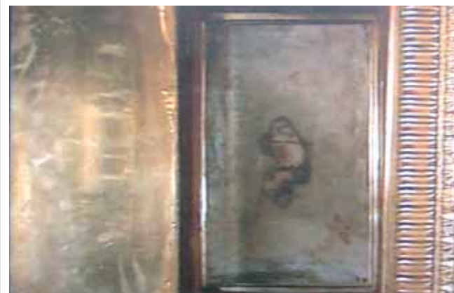
這個聖體龕中保存了其中一顆聖血奇蹟的石頭，目前存放於波瑟納。