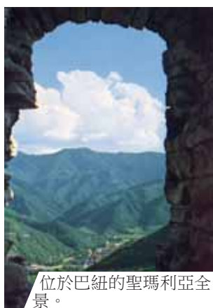
位於巴紐的聖瑪利亞全景。