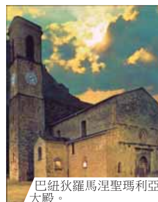
巴紐狄羅馬涅聖瑪利亞大殿。