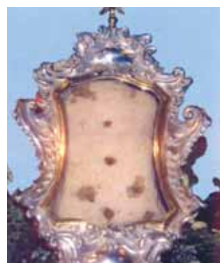
沾了血跡的九摺布。