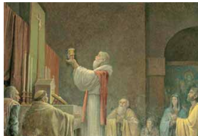
陳列在大殿中，描述奇蹟的畫。