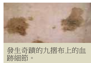
發生奇蹟的九摺布上的血跡細節。