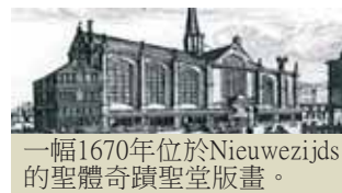
一幅1670年位於Nieuwezijds的聖體奇蹟聖堂版畫。