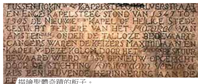
描繪聖體奇蹟的板子。