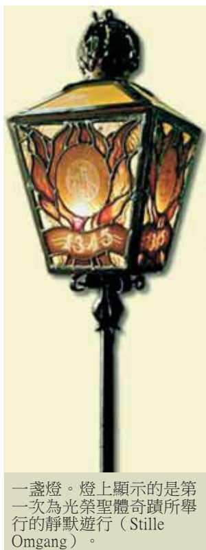
一盞燈。燈上顯示的是第一次為光榮聖體奇蹟所舉行的靜默遊行 (Stille Omgang)。