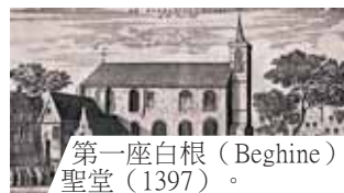
第一座白根 (Beghine) 聖堂 (1397)。