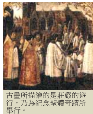
古畫所描繪的是莊嚴的遊行，乃為紀念聖體奇蹟所舉行。