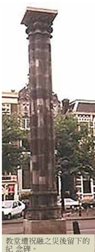
教堂遭祝融之災後留下的紀念碑。