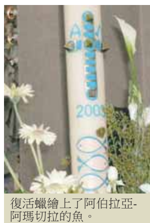
復活蠟繪上了阿伯拉亞-阿瑪切拉的魚。