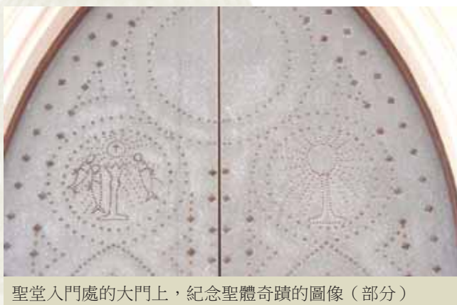
聖堂入門處的大門上，紀念聖體奇蹟的圖像（部分）