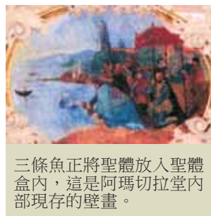
三條魚正將聖體放入聖體盒內，這是阿瑪切拉堂內部現存的壁畫。