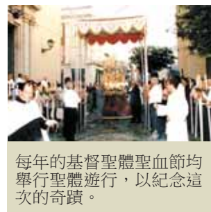
每年的基督聖體聖血節均舉行聖體遊行，以紀念這次的奇蹟。