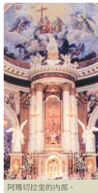
阿瑪切拉堂的內部。