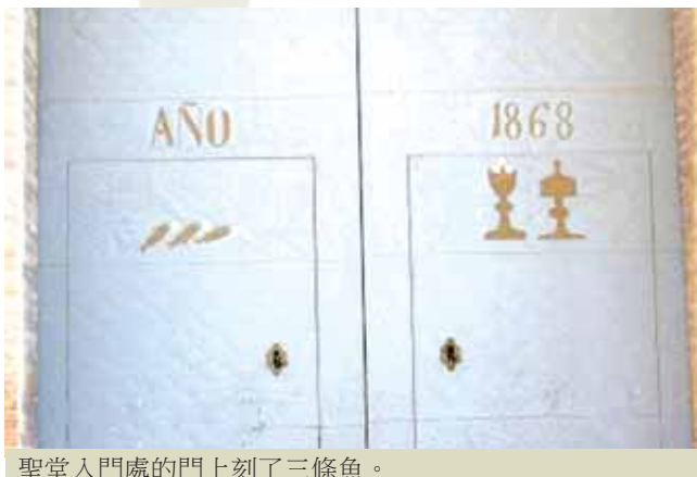
聖堂入門處的門上刻了三條魚。