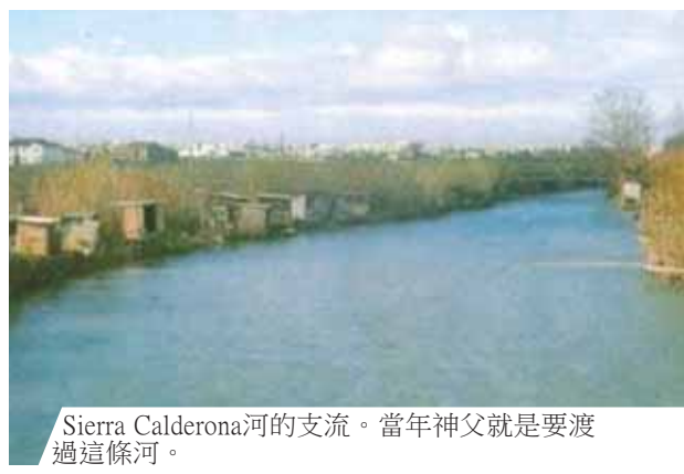
Sierra Calderona河的支流。當年神父就是要渡過這條河。