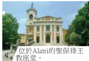
位於Alatri的聖保祿主教座堂。