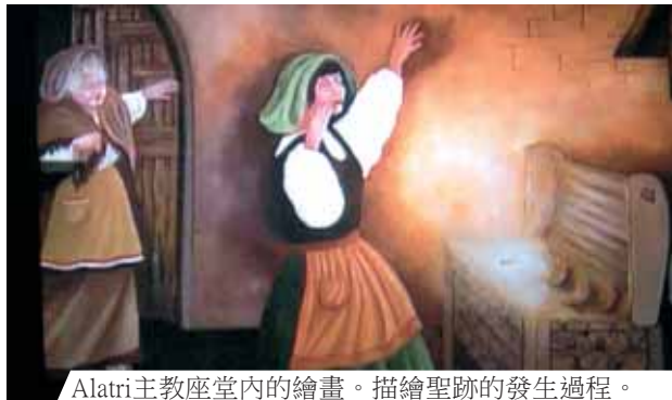
Alatri主教座堂內的繪畫。描繪聖跡的發生過程。

1228年時，義大利阿拉堤聖保祿宗徒主教座堂發生了聖體奇蹟，這塊轉變為血肉的聖體如今還保存於聖堂內。一名少女為了挽回未婚夫的愛情，聽信一位通靈者的話，在彌撒中偷了一塊聖體，準備用來治療情傷。回家後，當少女把偷藏在袖子裡的聖體拿出時，赫然發現聖體已經轉變為一塊淌著血的肉。許多文件都提到這件奇事，包括教宗額我略九世的詔書。