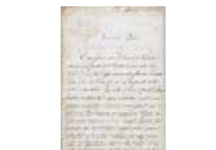
1888年3月22日，Saint Mary alle Terme的本堂神父所寫的信。信中感謝Alatri主教座堂贈與所保存的一小部分奇蹟聖體。