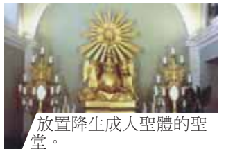
放置降生成人聖體的聖堂。