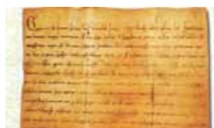
教宗額我略九世的Fraternitas Tuae (《友愛》詔書)。