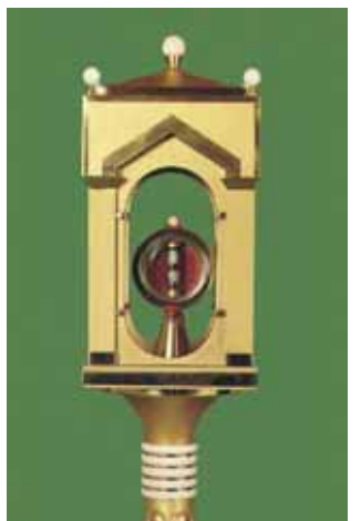
放置了聖體奇蹟的聖體光。